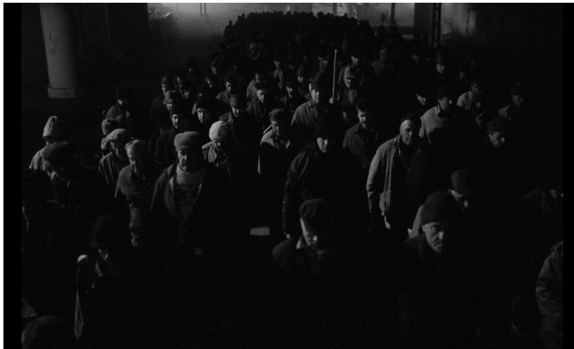
Figura 06: a massa percorre as ruas.

Em termos biopsicológicos, a massa hipnotizada pelo Príncipe sofre o que Daniel Goleman (2011, apud HACK, 2021) chamaria de um sequestro da amígdala cerebral. Quando o ambiente é percebido de forma aterrorizante, o cérebro ativa o Sistema Nervoso Autônomo Simpático, preparando o organismo para lutar ou fugir. Dominados pelo medo do desconhecido e inflamados pelo discurso do Príncipe, os homens da cidade abandonam o raciocínio lento do neocórtex (intelecto) e são tomados pelos instintos mais primitivos.