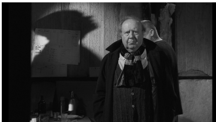
Figura 05: o Príncipe e seus discursos niilistas.

János maravilha-se hipnoticamente com a baleia, enquanto os homens da cidade são seduzidos pelo discurso destrutivo do Príncipe. O Príncipe incita o caos com afirmações niilistas como "Tudo é nada" e "Tudo é ruína". Nietzsche (2016) foi a favor da destruição, mas como parte do eterno devenir , ou seja, destruir para criar novos valores e não o aniquilamento vazio de sentido. O Príncipe, no entanto, é o pastor do niilismo passivo, transformando seus seguidores em braços destruidores sem rosto e sem vontades próprias. A arte e a ciência apolíneas são derrotadas por uma massa enfurecida e manipulada, sob o olhar morto de uma gigantesca baleia. A baleia representa o pathos , o sofrer de uma grande paixão, possuindo um magnetismo profundo. Para Nietzsche (2003), a natureza indomável possui conexão direta com o dionisíaco, momento em que o homem desaprende as regras e volta a se reconciliar com sua essência instintiva.