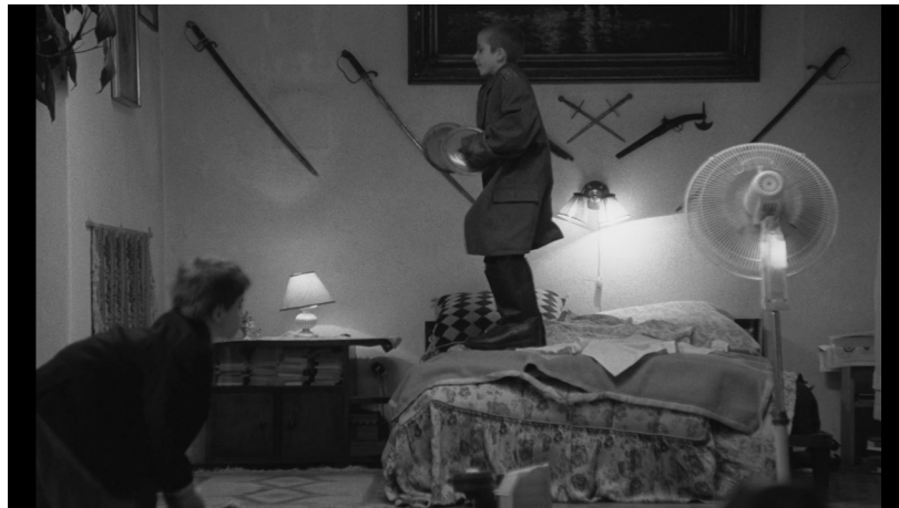
Figura 07: crianças se divertem na ausência da vigilância.